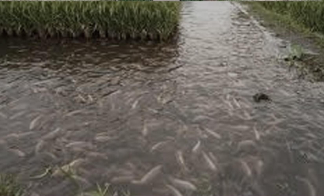
ออกแบบปก : ศุภาโชค ศรีรัตนศิลป์