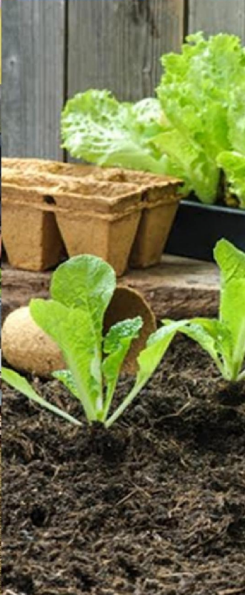
ออกแบบปก : ศุภโชค ศรีรัตนศิลป์