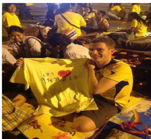
ชาวต่างชาติแสดงออกถึงความรัก และเทิดทูนพระบาทสมเด็จพระเจ้าอยู่หัวฯ

จากภาพเป็นความพร้อมเพรียงกันของพสกนิกรชาวไทยและชาวต่างประเทศที่ร่วมใจกันสวมเสื้อสีเหลือง ร่วมกันโบกธงชาติและธงพระปรมาภิไธยพร้อมกับเปล่งเสียงถวายพระพรเป็นการแสดงให้เห็นถึงความสมานฉันท์ของพสกนิกรชาวไทยและชาวต่างประเทศ ภาพเหตุการณ์เหล่านี้สร้างความแปลกใจให้กับสื่อต่างประเทศเป็นอย่างมาก จนทำให้สำนักข่าวหลายสำนักต้องเสนอข่าวเกี่ยวกับงานพระราชพิธีครั้งนี้เพิ่มเติม เพื่ออธิบายถึงเหตุผลที่ปวงชนชาวไทยถวายความจงรักภักดีและเทิดทูน สถาบันพระมหากษัตริย์มากมายขนาดนี้