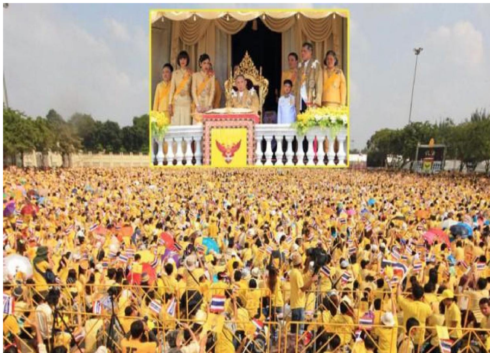
ประชาชนชาวไทยพร้อมใจกันเฝ้ารับเสด็จพระบาทสมเด็จพระเจ้าอยู่หัวฯ เสด็จออกมหาสมาคม ณ สีหบัญชร พระที่นั่งอนันตสมาคม เมื่อวันที่ 9 มิถุนายน 2549

จากภาพเป็นความพร้อมเพรียงกันของพสกนิกรชาวไทยและชาวต่างประเทศที่ร่วมใจกันสวมเสื้อสีเหลือง ร่วมกันโบกธงชาติและธงพระปรมาภิไธยพร้อมกับเปล่งเสียงถวายพระพรเป็นการแสดงให้เห็นถึงความสมานฉันท์ของพสกนิกรชาวไทยและชาวต่างประเทศ ภาพเหตุการณ์เหล่านี้สร้างความแปลกใจให้กับสื่อต่างประเทศเป็นอย่างมาก จนทำให้สำนักข่าวหลายสำนักต้องเสนอข่าวเกี่ยวกับงานพระราชพิธีครั้งนี้เพิ่มเติม เพื่ออธิบายถึงเหตุผลที่ปวงชนชาวไทยถวายความจงรักภักดีและเทิดทูน สถาบันพระมหากษัตริย์มากมายขนาดนี้