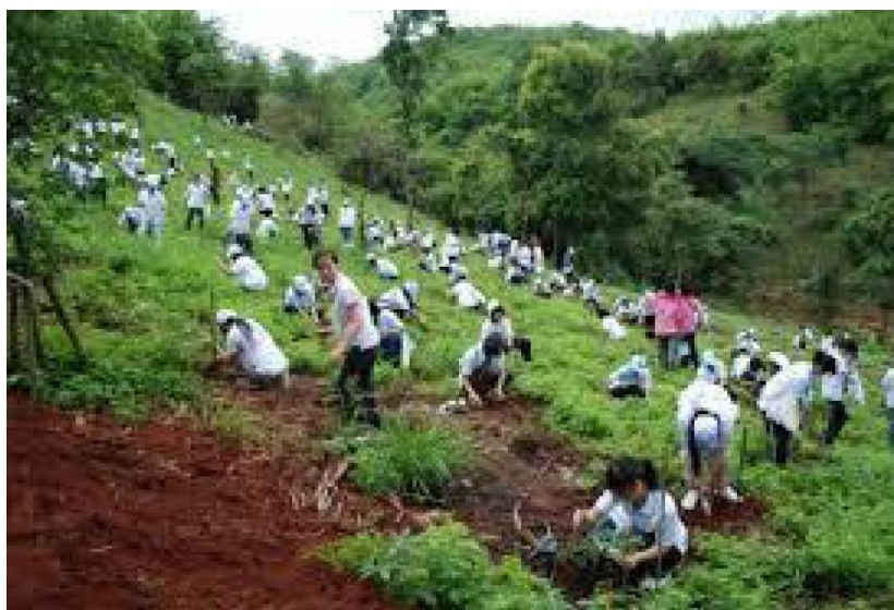
ประชาชนร่วมกิจกรรมปลูกป่าชุมชน

12. คำนึงถึงผลประโยชน์ของส่วนรวมและต่อชาติมากกว่าผลประโยชน์ของตนเอง ให้ความร่วมมือใน กิจกรรมที่เป็นประโยชน์ต่อส่วนรวม และประเทศชาติ เสียสละประโยชน์ส่วนตนเพื่อรักษาประโยชน์ของส่วนรวม