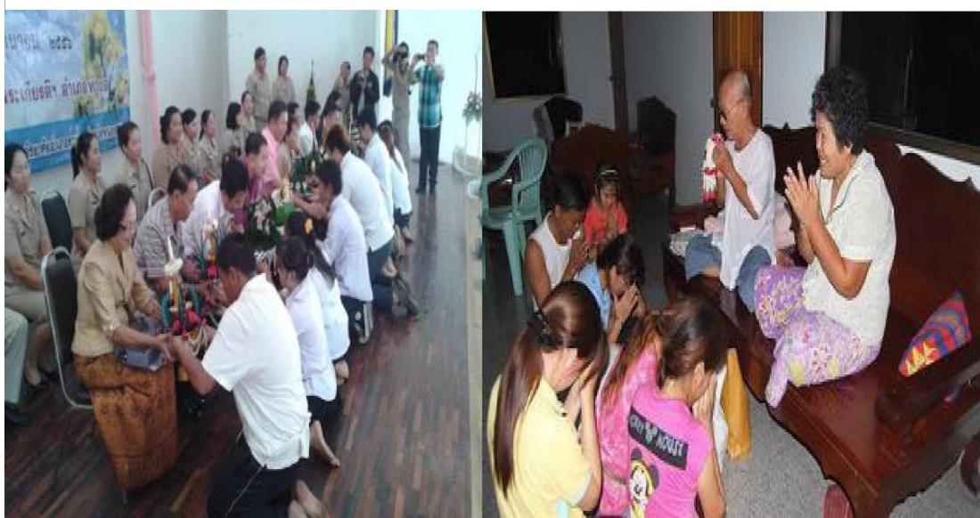
ประชาชนร่วมกิจกรรมแสดงความกตัญญูทเวท

3. กตัญญูต่อพ่อแม่ ผู้ปกครอง ครูบาอาจารย์เป็นคุณลักษณะที่แสดงออกถึง การรู้จักบุญคุณ ปฏิบัติตามคำสั่งสอน แสดงความรัก ความเคารพ ความเอาใจใส่ รักษาชื่อเสียง และตอบแทนบุญคุณของพ่อแม่ ผู้ปกครอง และครูบาอาจารย์