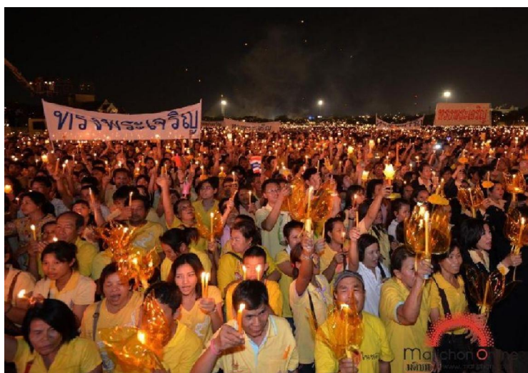
ประชาชนร่วมกิจกรรมจุดเทียนถวายพรพระบาทสมเด็จพระเจ้าอยู่หัวฯ

1. มีความรักชาติ ศาสนา พระมหากษัตริย์ เป็นคุณลักษณะที่แสดงถึงรักความเป็นชาติไทย เป็นพลเมืองดีของชาติ มีความสามัคคี เชิดชูความเป็นไทย เห็นคุณค่า ภูมิใจ ปฏิบัติตนตามหลักศาสนาที่ตนนับถือ และแสดงความจงรักภักดีต่อสถาบันพระมหากษัตริย์